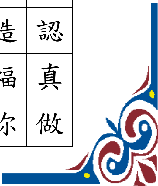
財團法人林心正教育基金會第五屆『永傳盃』硬筆書法比賽報名表